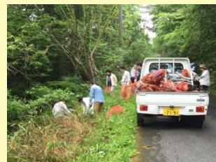
環境美化運動 市内のゴミ拾い活動に参加し街の 環境美化に努めています！