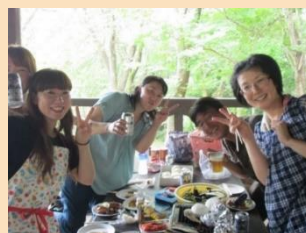
BBQ 夏には職員や職員の家族が集まり 盛大なBBQも開催してます！