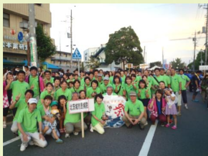
市民夏祭り 北茨城市で開催する夏祭りに市民病院チームとして、「市民音頭」に毎年参加し、地域の 人達との交流を大切にしています。