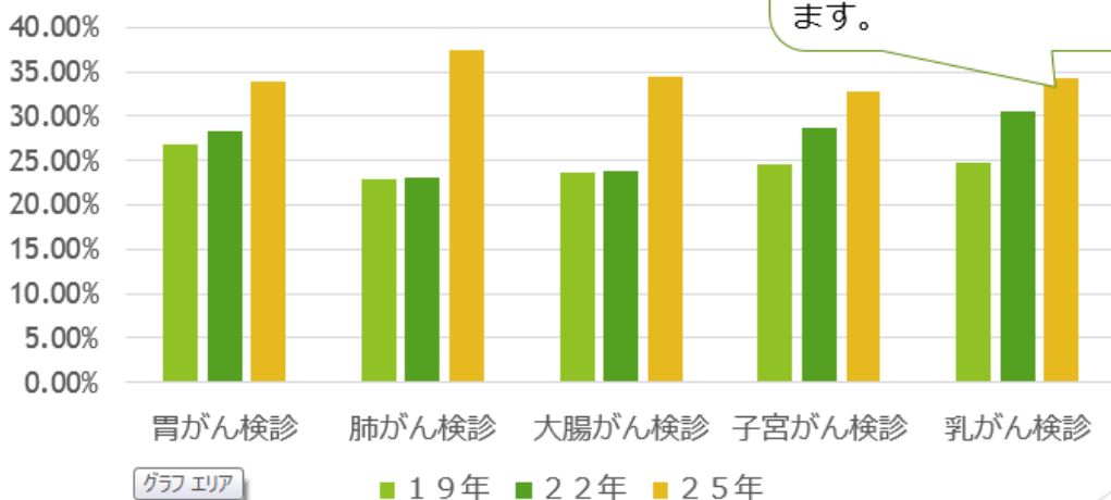
がん検診受診率（女性）