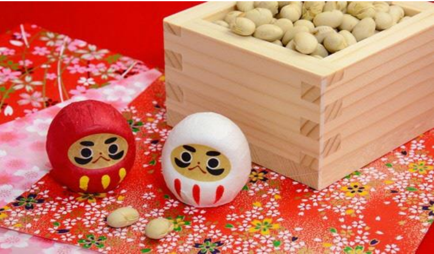
あだち すずむ 外科 安達 伸